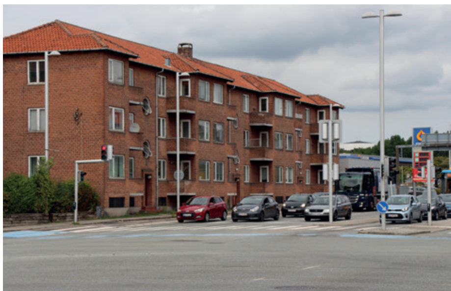
En del bygninger omkring Ringvejskrydset bliver revet ned for at gøre plads til letbanen.