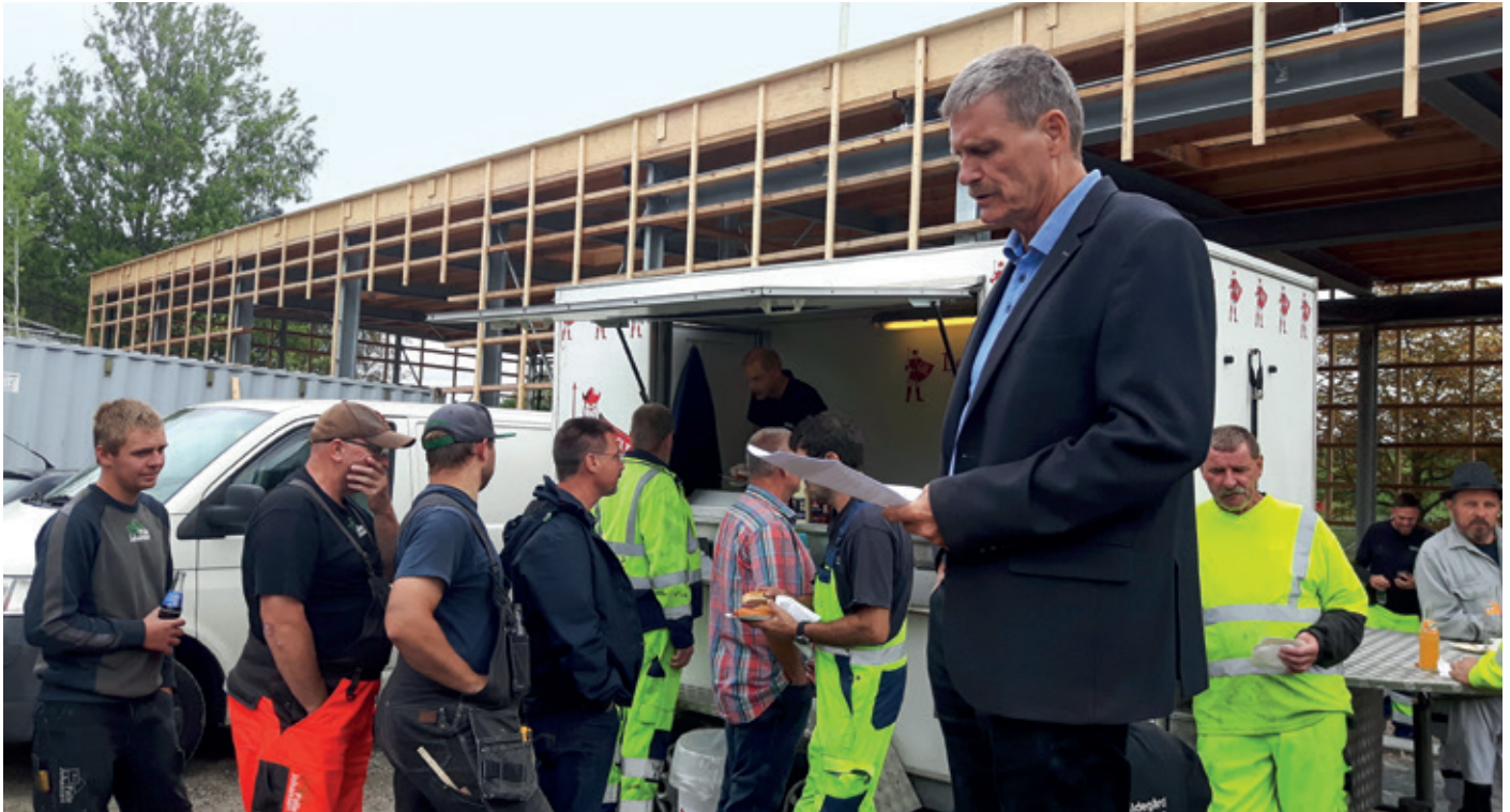
Traditionen tro blev der i august måned afholdt rejsegilde.

Det er besluttet at udvide genbrugsstationens tilgængelighed med ubemandet åbningstid i ydertimerne, så kunderne bedre kan besøge Genbrugsstationen, når de har behov for det.