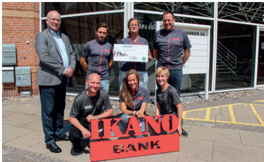
Ikano Bank og Bording Data løb med præmierne i år.

Den daglige cykeltur gør rigtig meget både for den enkeltes sundhed, for klimaet og for trængslen på vores veje. Jeg håber, at de ansatte fra vores virksomheder vil holde fast i de gode cykelvaner - særligt i den kommende tid, når vi