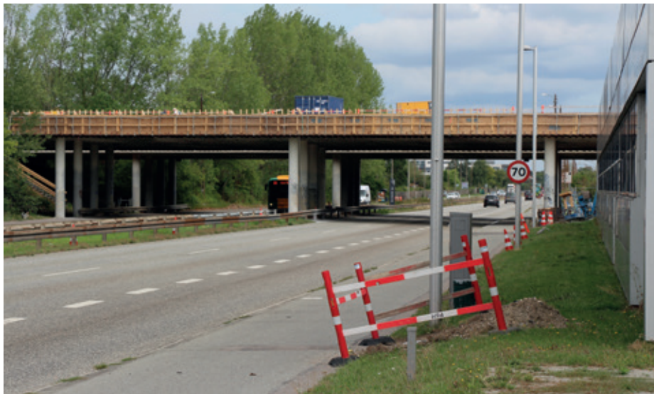
Den eksisterende bro i Ejby renoveres.

Dermed er arbejdet med Hovedstadens Letbane for alvor gået i gang. Når letbanen står klar til brug i 2025, kommer den til at køre mellem Lyngby og Ishøj og binde seks S-togs-linjer sammen på tværs af hovedstaden.