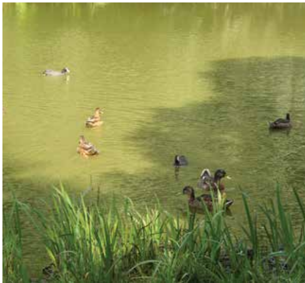
Blågrøn alger kommet af meget næring, der bl.a. stammer fra andefodring.

Søernes tilstand afhænger af, hvad der tilføres dem. Søerne i Glostrup er meget forskellige. Nogle er klarvandede med et rigt dyre og planteliv. Nogle er lave og lidt sumpede. Mens andre igen er uklare og præget af stor næringstilførsel.