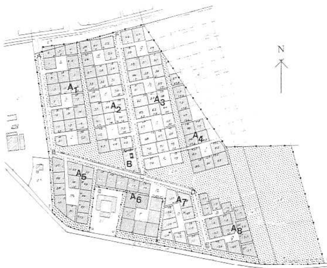
Situationsplan i mål 1:1000